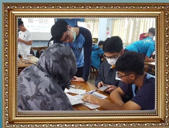
（右圖）學生在航海地圖中畫出前往馬六甲的航線。