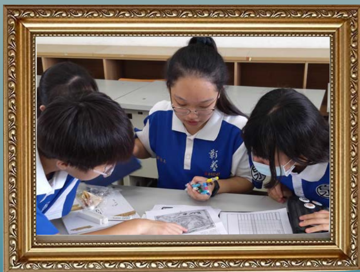
（左圖）學生自行研讀關卡任務，進行討論與尋找答案。

✎ 遊戲中的其中一個任務，即是要學生能站在統治者的角度進行城市規劃，花錢購買建築（鴉片煙管、會館、清真寺、水圳等）前，必須考量殖民者利益、各族群的需求與衝突，甚至思考不同族群的分布與自然環境的關係，在吉隆坡簡略地圖上進行規劃與建設。在遊戲解密的後設環節中，教師也能進一步帶領學生思考城市地景的形成過程。