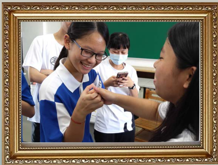
(圖) 學生以「拇指決鬥」模擬族群械鬥，不同族群間需要「站隊」、思考族群利益。