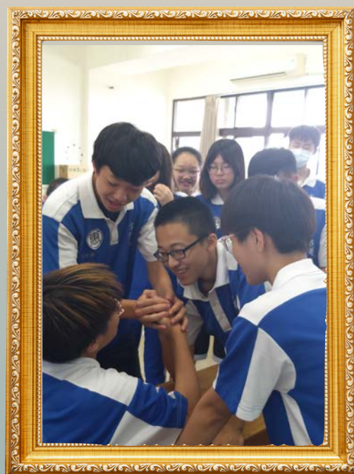
(圖) 學生以「扳手腕」模擬族群械鬥，不同族群間需要「站隊」、思考族群利益。

教學目標確立後，接下來就是設計更細節的問題並思考教學方法的安排，在我們的遊戲式設計中就必須思考：遊戲目的、遊戲角色、立場設定、故事場景設定、議題故事撰寫、選擇問題、關卡任務、獲勝條件、遊戲機制等。