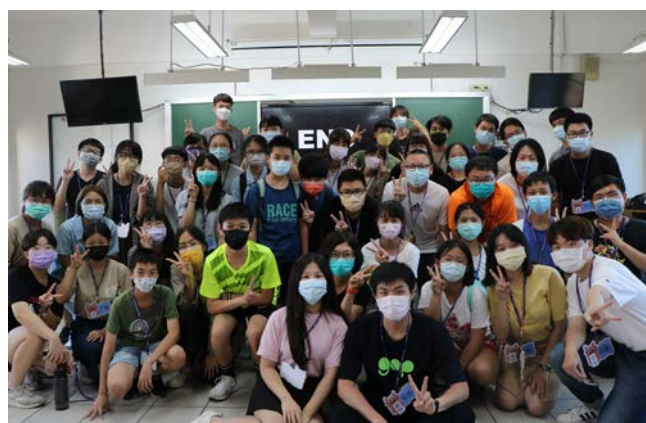
營隊成員與學生合照