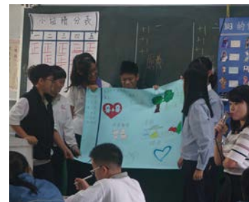
學生上台創意發表