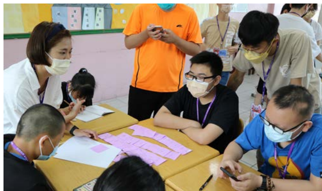
學生認真參與課堂

我想，這就是教育的本質，春風化雨，用心耕耘，總有一天，精心培育的桃李會在門前盛放。