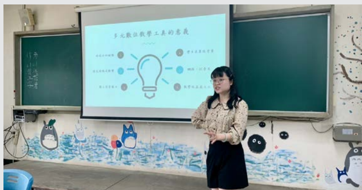
國文教師社群科技化講師分享