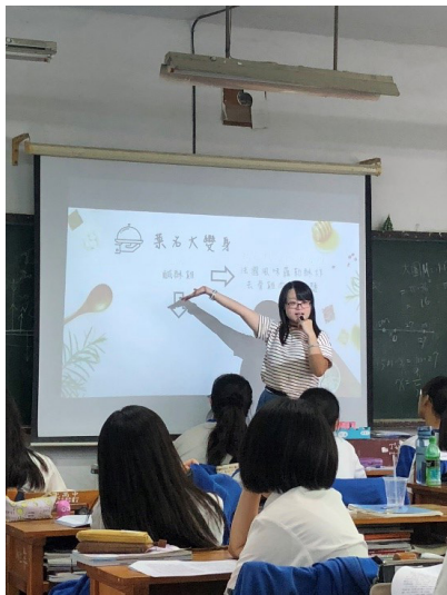
高中多元選修上台授課

說這些並不是想要嚇唬學弟妹們，但這是真實在生活中最裸露的教甄圖樣。在你踏入教甄考場時，你的前方已經累積了無數更有經驗的教師們，如何在這動輒上千人的考試中脫穎而出，就是你從現在可以開始思考的一個問題了。一旦下定決心要走向教師之路，請放下一切的得失心，你只能不斷的向前走，不斷的修正自己的教學方針，讓自己有一天可以被看見。就算再怎麼路途遙遠，如果這個方向是你所愛，請記得你在這條路上堅守的原因，讓這份力量可以支撐你繼續走下去。