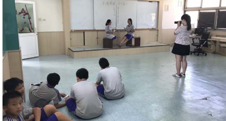
指導班級競賽獲獎合照

教師，是學校龐大體系中的根本，但如何維持這個體系的運轉，就必須靠教師的執行。教師的工作並非只有教學，配合教育單位或是學校的政策，更是教師的責任，不論是擔任行政組長或是導師工作，都是應盡的義務與責任。唯有調適與配合，才能使學校和諧且發展更具未來性。