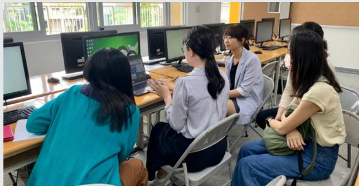
指導同事 Kahoot 和 Quizizz