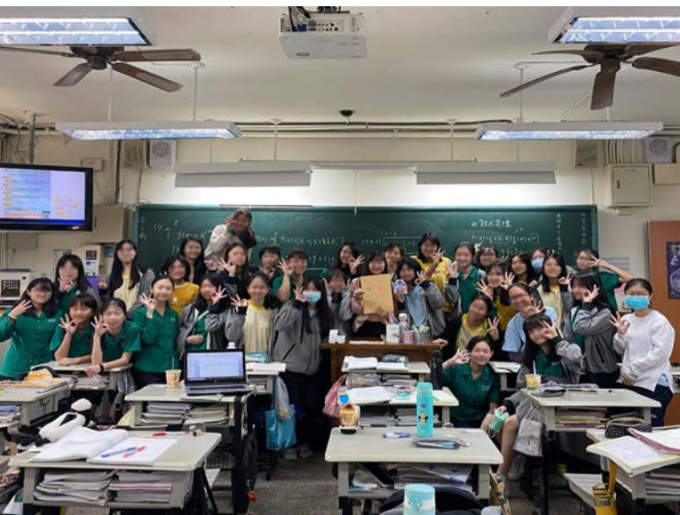
對學生的用心，學生都能感受到