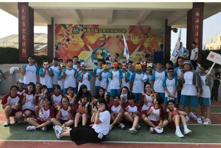
指導班級競賽獲獎合照

期許各位學弟妹能成為用心陪伴、體察學生需求並引領向前的師者，而不畏懼未來的所有，讓自己成為一個溫暖的存在。別讓自己變成一名只會教書的老師，你能做的是更多：熱愛教學、關愛學生、協助孩子、品味生活、體驗人生，且在職涯生活中找到屬於自己的獨一無二。