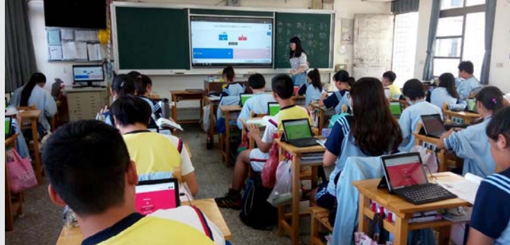
使用 kahoot 進行教學

科技當道的時代，電腦的運用是不可或缺的能力。平板教學、科技互動（如：Kahoot、Quizizz……等）、媒體結合、跨時空協作（如：Padlet）、圖文創作（如：Canva）……等，都是這些年越來越多新興教師在使用的系統。有效的使用電腦，不僅可以使部分的教學更加順暢，也可以使課堂氣氛更為活絡。但，在科技教學這部分仍然與學校本身的資源有高度相關，儘管政府現在推行「生生用平板」的美意政策，可卻不是每個地區都有辦法讓平板的運用達到最大效用，所以教師在進入新環境時，請一定要觀察當地教學氛圍，也觀察當地孩子的學習情形，讓教師的教學專業可以與當地結合、配合學校，否則美意便失了它應該有的美好。